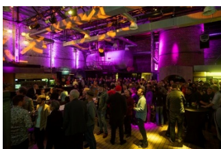
Connecting-Audio-Night_2.jpg: Feierstimmung bei der Connecting Audio Night, der Party-Nacht des VDT.