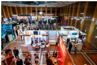
tmt32-Ausstellung_1.jpg: (© Boris Loehrer)