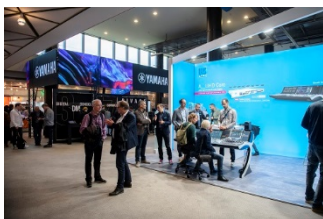
tmt32-Ausstellung_7.jpg: (© Boris Loehrer)