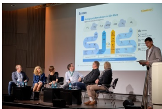
Nachhaltigkeit.jpg: Ulrich Lorscheider organisierte eine Diskussionsrunde zum Thema Nachhaltigkeit in der Pro-Audio-Branche.