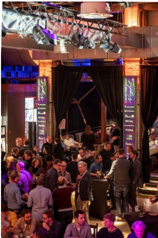
Connecting-Audio-Night_3.jpg: Feierstimmung bei der Connecting Audio Night, der Party-Nacht des VDT.