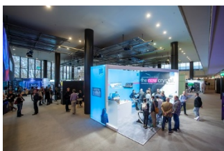
tmt32-Ausstellung_8.jpg: (© Boris Loehrer)