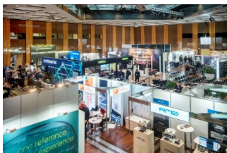
tmt32-Ausstellung_2.jpg: (© Boris Loehrer)