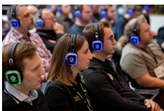
Open-Stage_1.jpg: Vollbesetzte Open Stage auf der tmt32. Funkkopfhörer ermöglichen dort ein konzentriertes Zuhören inmitten der Ausstellung.