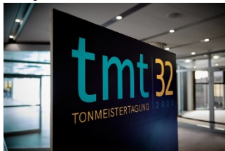
tmt32-Opener.jpg: Die 32. Tonmeistertagung