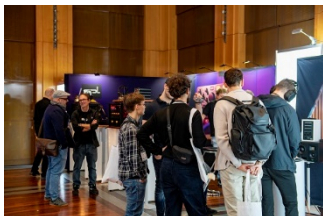
tmt32-Ausstellung_6.jpg: (© Boris Loehrer)