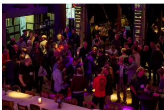
Connecting-Audio-Night_1.jpg: Feierstimmung bei der Connecting Audio Night, der Party-Nacht des VDT.