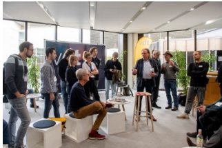
3_VDT-Lounge.jpg: Die VDT-Lounge bot Platz für viele ad-hoc-Thementreffen.