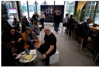
2_VDT-Lounge.jpg: Die VDT-Lounge mit Caféhaus-Ambiente war ein Anziehungspunkt zum Verweilen