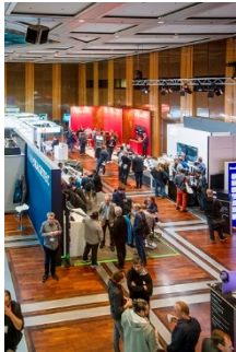
tmt32-Ausstellung_5.jpg: (© Boris Loehrer)