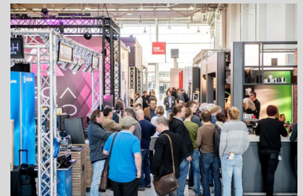
Download TMT Messebetrieb