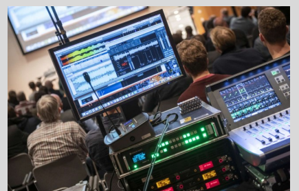
Download TMT Vortrag