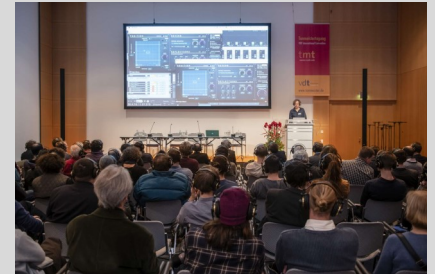
Download TMT Kongressvortrag